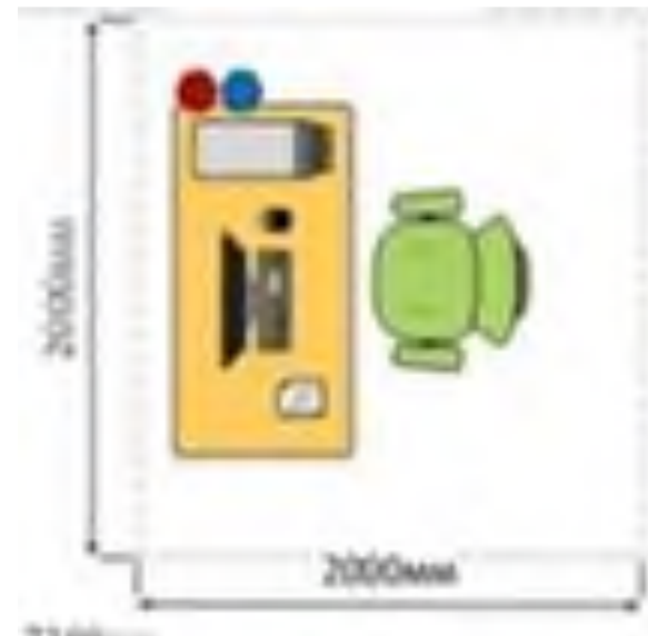
Рабочее место участника (2X2 м) в составе: стол; стул; компьютер; монитор; клавиатура; мышь; USD-накопитель; набор ПО