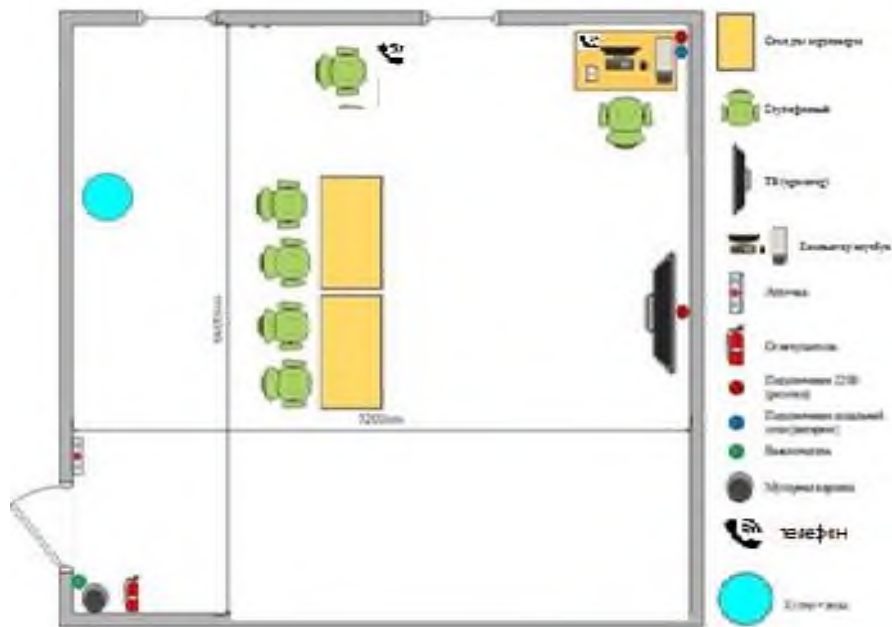
Зона площадки А