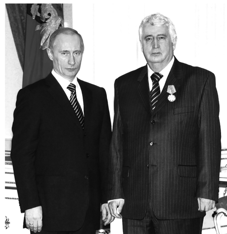
Президент РФ Владимир Владимирович Путин вручает орден Почёта.