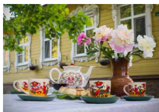
Гостевой дом Дача (Ивановская область, г. Южа)