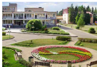
Санаторий Виктория (Московская область, г. Пушкино)