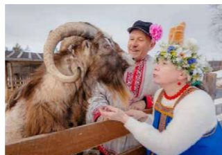
Ферма Ивановка (Тверская область)