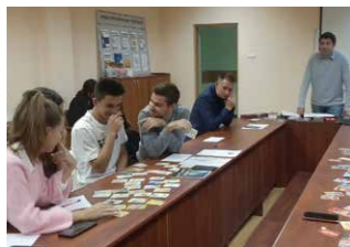
PMAT (Московская область, г. Химки)