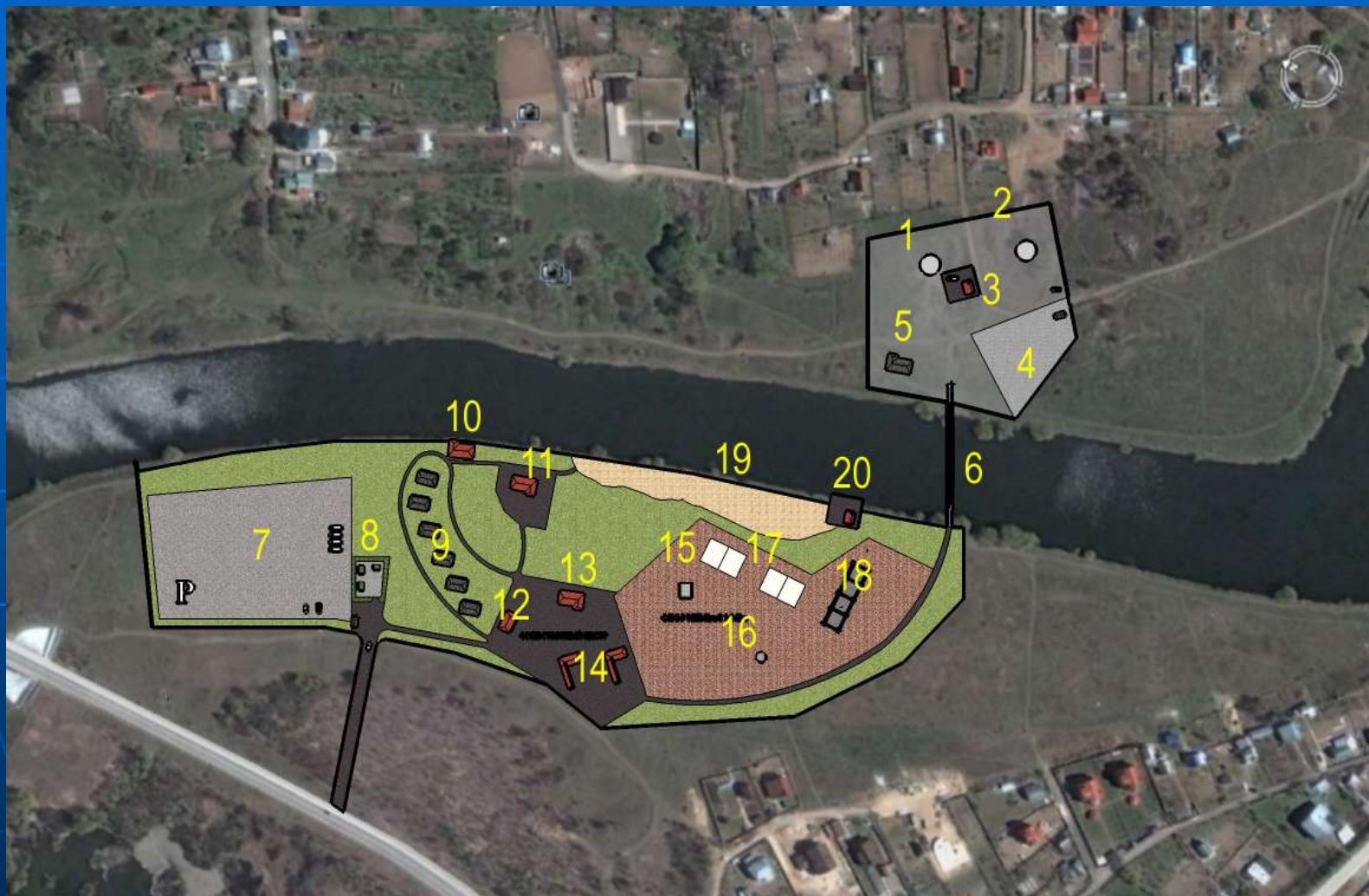
Схема зонирования территории